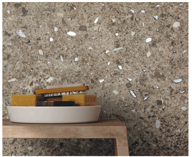
Wall: Materia Eclettica Luci Tortora Inserto Floor: Materia Eclettica Tortora

teintes claires - neutres inspirées de la pierre, des cailloux, de la lave et des minéraux