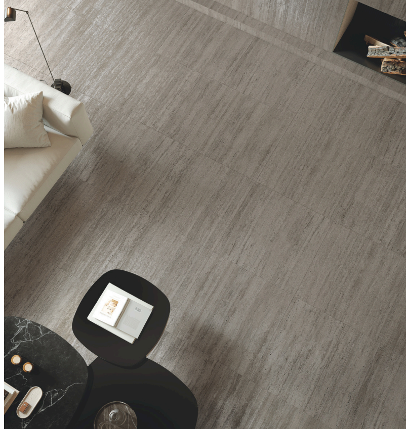
Wall & Floor: Materia Classica Tortora Boiserie: Materia Classica Groove Tortora & Matita Tortora