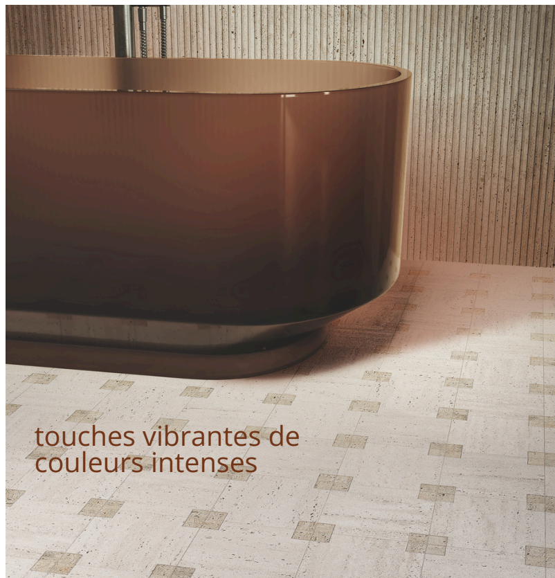
Wall: Materia Classica Beige, Groove Beige & Oro Boiserie Inserto Floor: Materia Classica Beige & Beige Bianco Icon D Mosaico